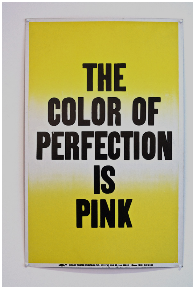
ALLEN RUPPERSBERG POSTER OBJECTS, 1991 serigraphie sur matériaux divers, Collection FRAC Poitou-Charente

ANGOULÊME LE FRAC POITOU-CHARENTES PRESENTE DES OEUVRES D'ALLEN RUPPERSBERG EN VITRINES