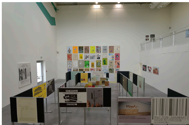
Exposition SOMMAIRE. Frac Poitou-Charente.

En 2013, le FRAC Poitou-Charentes et les Galeries Lafayette Angoulême se sont associés à l'occasion de l'anniversaire des 30 ans des FRAC en 2013. Une installation de l'artiste Heidi Wood avait ainsi été présentée dans une vitrine du magasin. En 2017, avec la présentation d'une œuvre d'Allen Ruppersberg, c'est un nouveau chapitre qu'écrivent ensemble les Galeries Lafayette et le FRAC Poitou-Charentes.